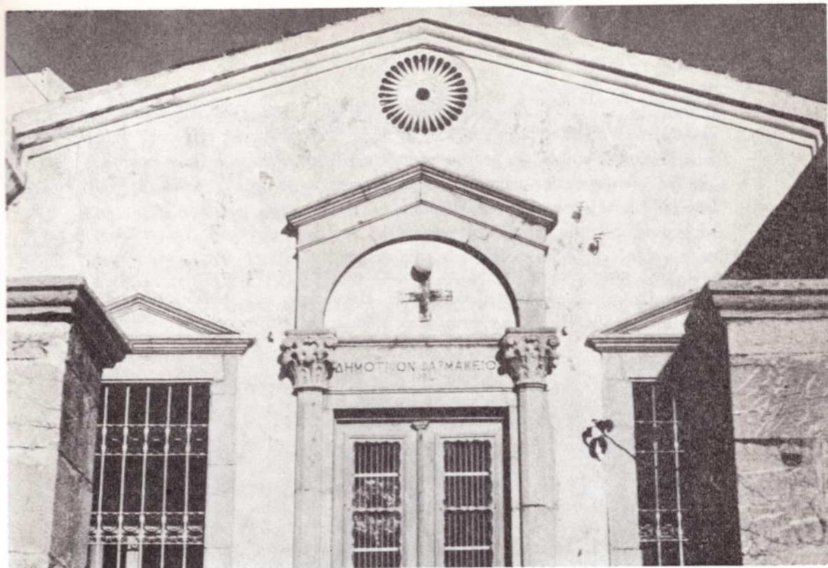
Τὸ Δημοτικὸ Φαρμακεῖο. Κτίσθηκε τὸ 1884

πρὸς ἀνέυρεσιν ἱατροῦ καὶ διδασκάλου, ὡς τὰ εἰς χεῖράς μου ἔγγραφα καὶ ὡς αἱ πρὸς τὴν Κοινότητα ἐπιστολαὶ μου ἐκ Σμύρνης τῶν 4, 11 καὶ 18 Αὐγούστου 1862. Εἰς αὐτὰς καὶ εἰς τὰ ἀνά χεῖρας συμφωνητικὰ τοῦ ἱατροῦ καὶ τοῦ διδασκάλου ἀποδεικνύονται αἱ προπληρωμαὶ ἀπέναντι τῶν μισθῶν των.