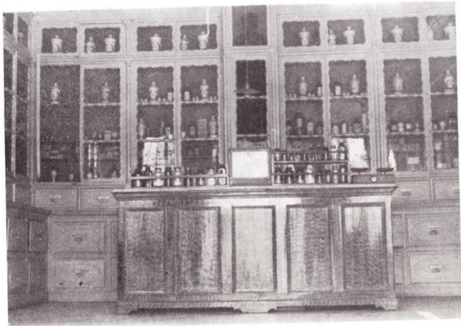
Τμήμα ἀπὸ τὸ ἐσωτερικὸ τοῦ Δημοτικοῦ Φαρμακείου

Εἰς παλαιότερας ἐποχὰς τὸ φαρμακεῖον τῆς νήσου ἐστεγάζετο εἰς τὴν "Ἄνω Πόλιν, εἰς τὴν θέσιν Ἑλαιμυνας 1 . Βραδύτερον καὶ συγκεκριμένως ἀπὸ τοῦ ἔτους 1884 εἶχεν ἐγκατασταθῆ εἰς εἰδικῶς διὰ τὸν σκοπὸν αὐτὸν κτισθὲν