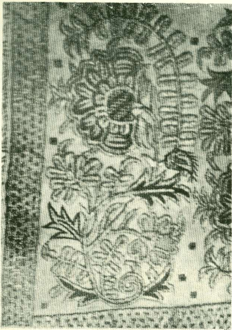
Χρυσοκέντητος «τσεβρέ» τοῦ 18ου αἱ.

Τὸ χάρισμα αὐτὸ τὸχουν οἱ Τριαντάφυλλοι, οἱ Πάχοι καὶ οἱ Γιαννάδες, οἱ Σαρήδες καὶ οἱ Χατζηνικήτηδες (Συνοδάκια), οἱ Καρταπάνηδες,