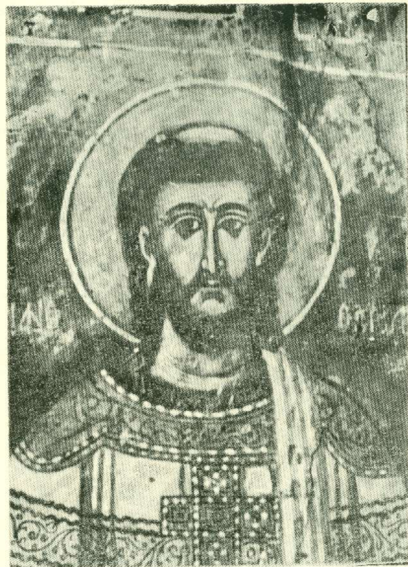
Ὁ Ἅγ. Ῥωμανός. Τοιχογραφία ἀπὸ τὸ καθεδρικό τοῦ Μιχαὴλ τοῦ Κοκκιμήδη (18ος αἰ.).

μονητικὰ καὶ μὲ σιγουριά ἀπὸ τοὺς Παραῆδες Ξύπηδες καὶ δεκάδες ἄλλων «πελεκάνων».