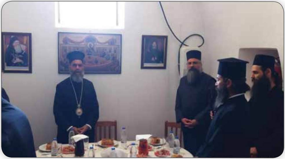
Στιγμιότυπα ἐκ τῆς προσκυνηματικῆς ἐπισκέψεως τῶν Ἱεροσπουδαστῶν τῆς Ριζαρείου Ἐκκλησιαστικῆς Σχολῆς εἰς τὴν Ἱ. Μονὴ Ρουκουνιώτου τὴν Κυριακὴ 30ῆ Ἰουνίου 2019.