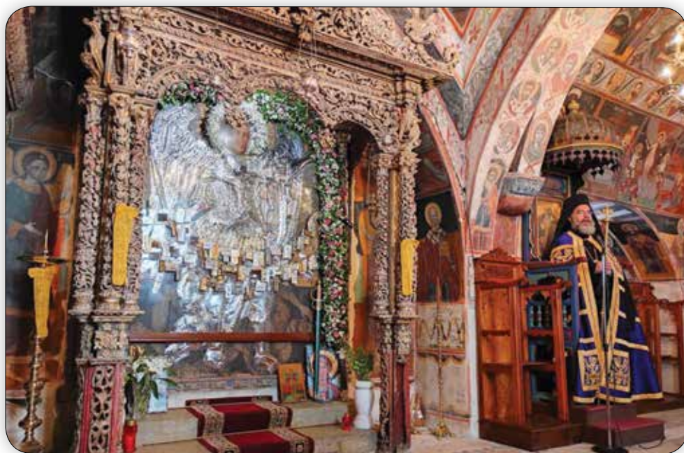
Στιγμιότυπα ἐκ τῆς μεθεόρτου Θ. Λειτουργίας τοῦ Σεβ. Μητροπολίτου Σύμης κ. Χρυσοστόμου στήν πανηγυρίζουσα Ἱ. Μονή Ρουκουνώτου τήν 14η Νοεμβρίου 2021.