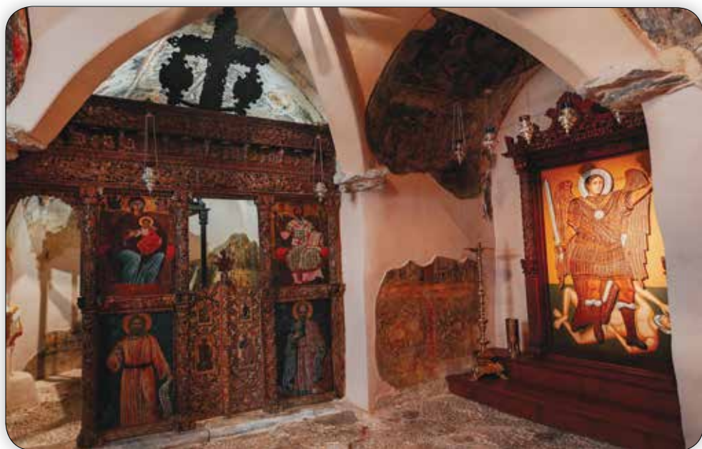
Ἐσωτερική ἄποψη τοῦ Παλαιοῦ Καθολικοῦ τῆς Ἱερᾶς Μονῆς Ρουκουνιώτου.