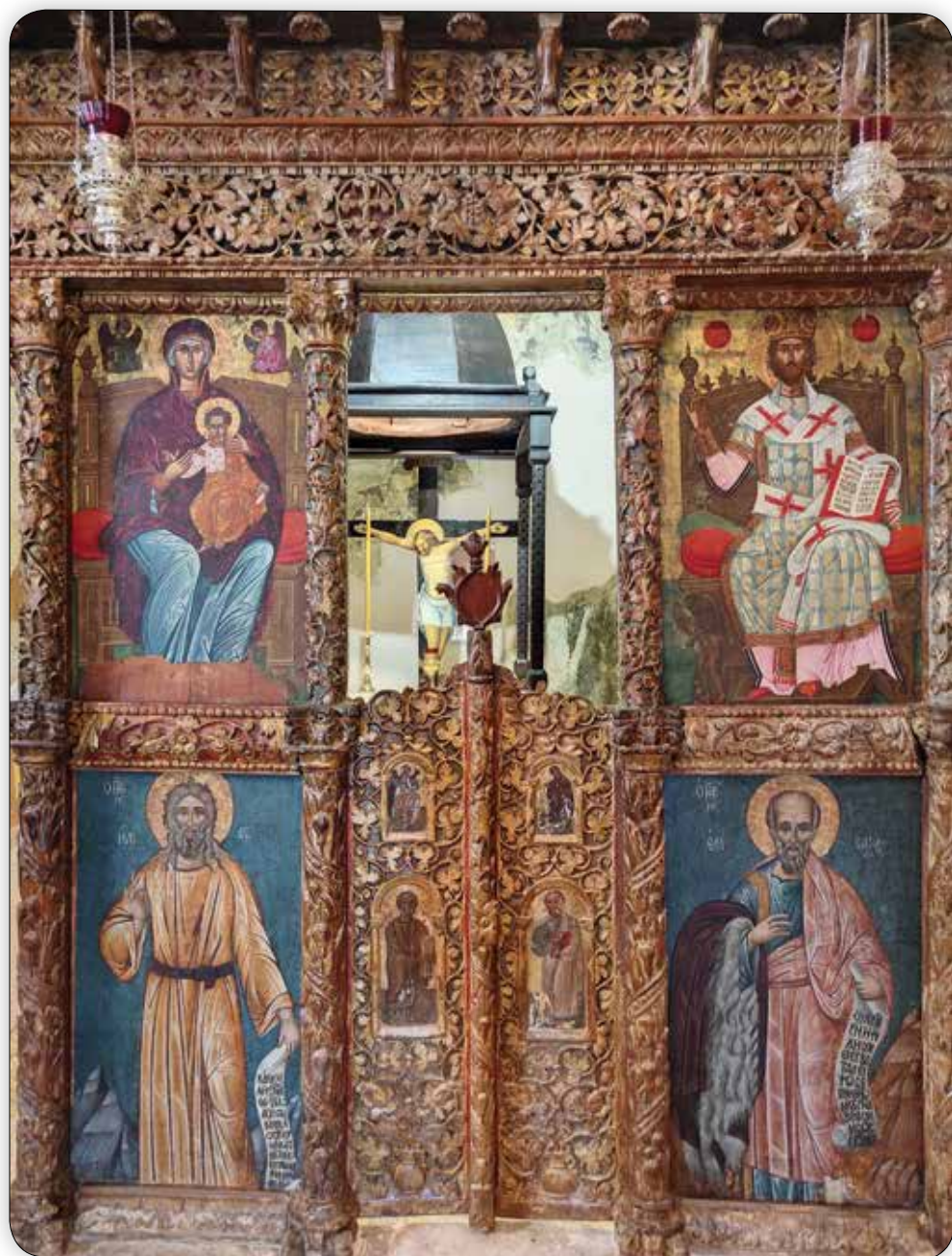
Γενική άποψη του Τέμπλου του Παλαιού Καθολικού της Ίερᾶς Μονῆς Ρουκουνώτου.