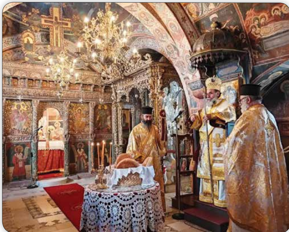
Ὁ Σεβ. Μητροπολίτης Σύμης κ. Χρυσόστομος λειτουργός στήν Ἱερά Μονή Ρουκουιῶτου τὴν 14ῃ Νοεμβρίου 2021.