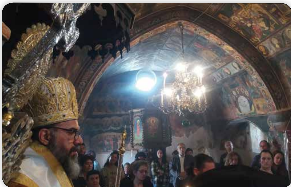
Ὁ Σεβ. Μητροπολίτης Σύμης κ. Χρυσόστομος λειτουργός στήν Ἱερά Μονή Ρουκουινιώτου τήν Κυριακή τοῦ Θωμᾶ 2018.