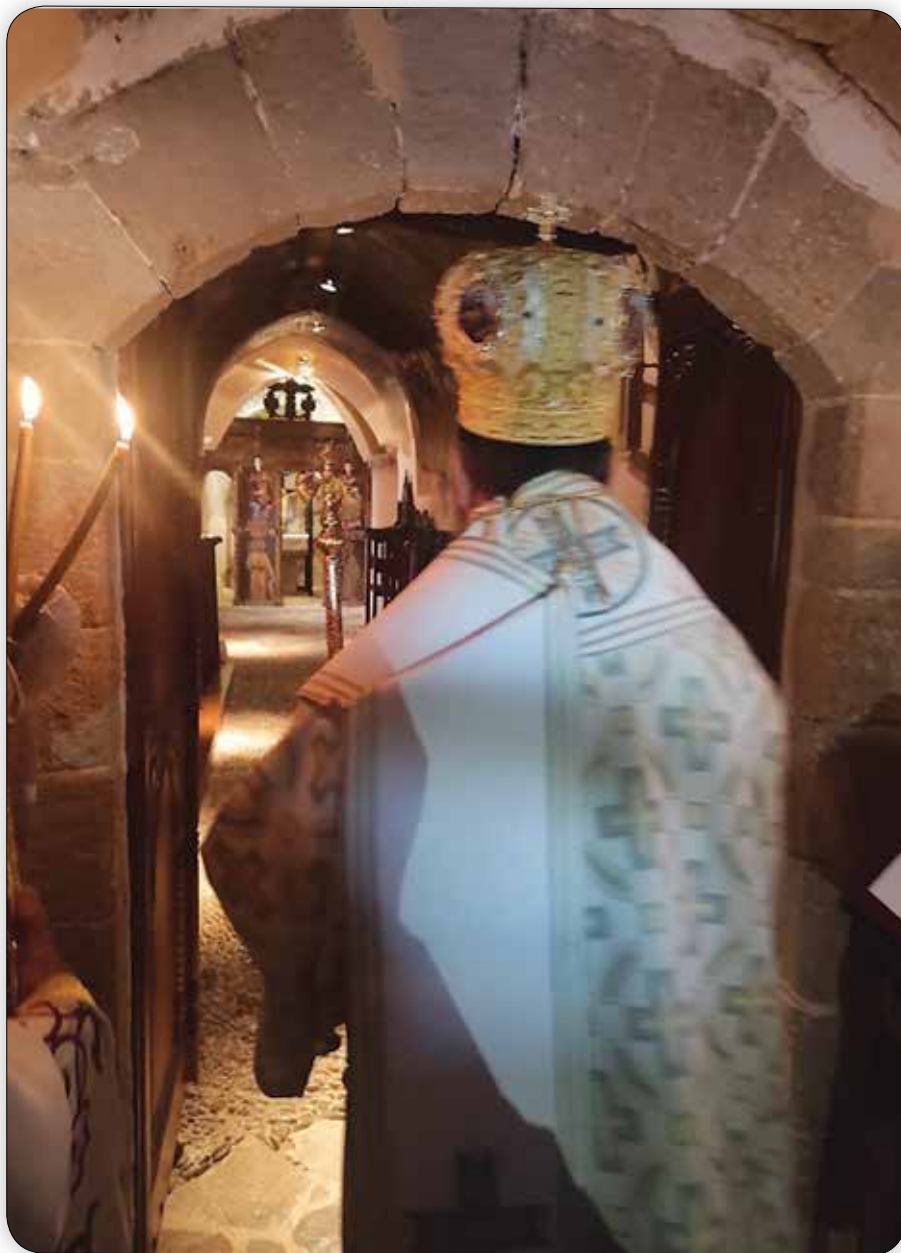
Στιγμιότυπο ἐκ τῆς τελετουργίας τῆς Εἰσόδου τοῦ Σεβ. Μητροπολίτου Σύμης κ. Χρυσοστόμου εἰς τό Παλαιόν Καθολικόν.