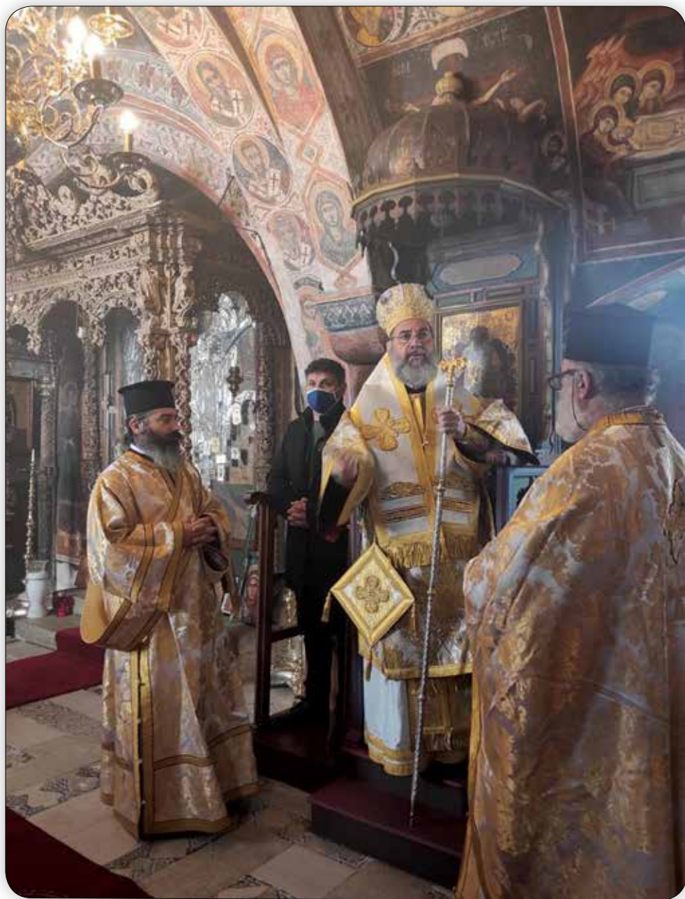
Στιγμιότυπα ἐκ τῆς Θ. Λειτουργίας τοῦ Σεβ. Μητροπολίτου Σύμης κ. Χρυσοστόμου στήν Ἱερά Μονή Ρουκουνιώτου. Ἰανουάριος 2021.