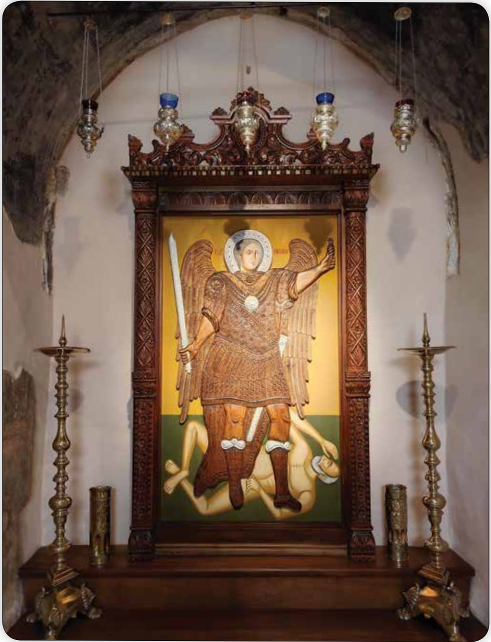
Τό Εικόνοστάσιο καί ἡ ξυλόγλυπτος Εἰκόνα τοῦ Ταξιάρχου Μιχαήλ Ρουκουνιώτου, ἔργον τῶν Συμαίων Ευλογηπτῶν Μιχαήλ καί Ἰακώβου Μισοῦ.