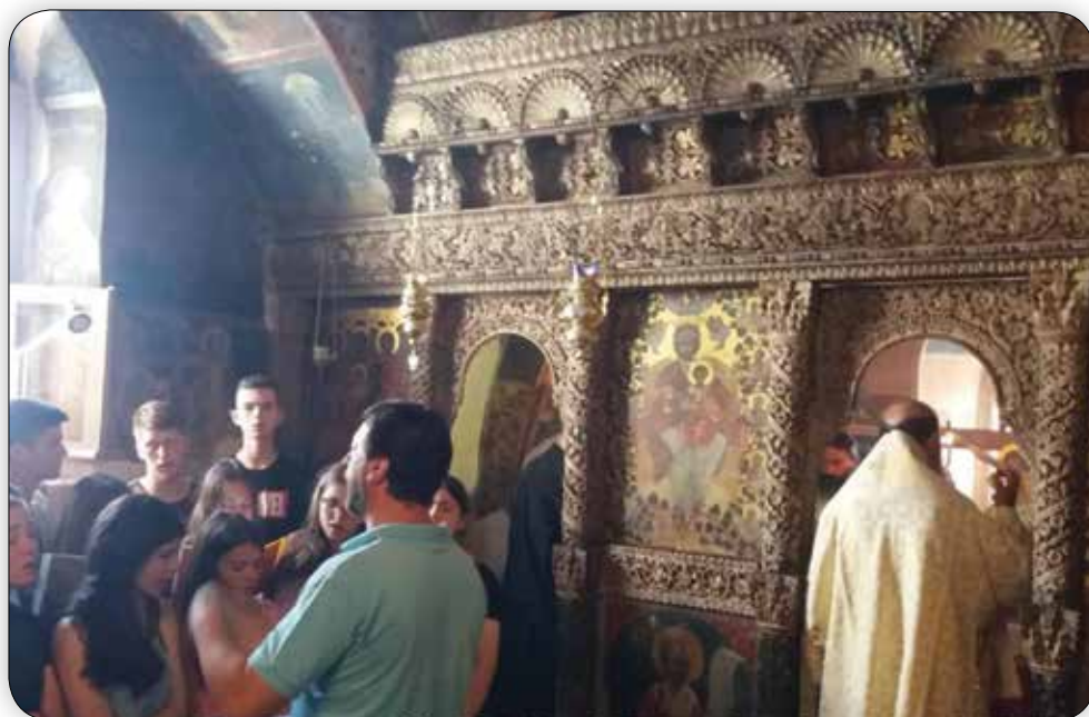
Στιγμιότυπα ἐκ τῆς προσκυνηματικῆς ἐπισκέψεως τῶν Ἱεροσπουδαστῶν τῆς Ριζαρείου Ἐκκλησιαστικῆς Σχολῆς εἰς τὴν Ἱεράν Μονή Ρουκουνιώτου τὴν Κυριακὴ 30ῆ Ἰουνίου 2019.