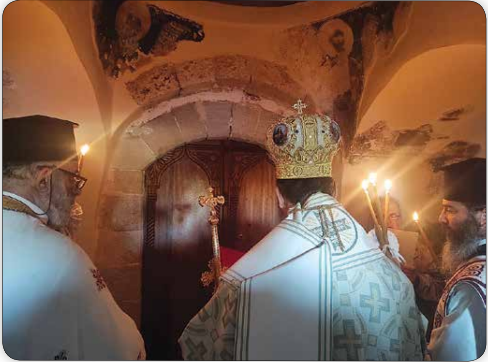
Στιγμιότυπο ἐκ τῆς τελετουργίας τῆς Εἰσόδου τοῦ Σεβ. Μητροπολίτου Σύμης κ. Χρυσσοστόμου εἰς τό Παλαιόν Καθολικόν.