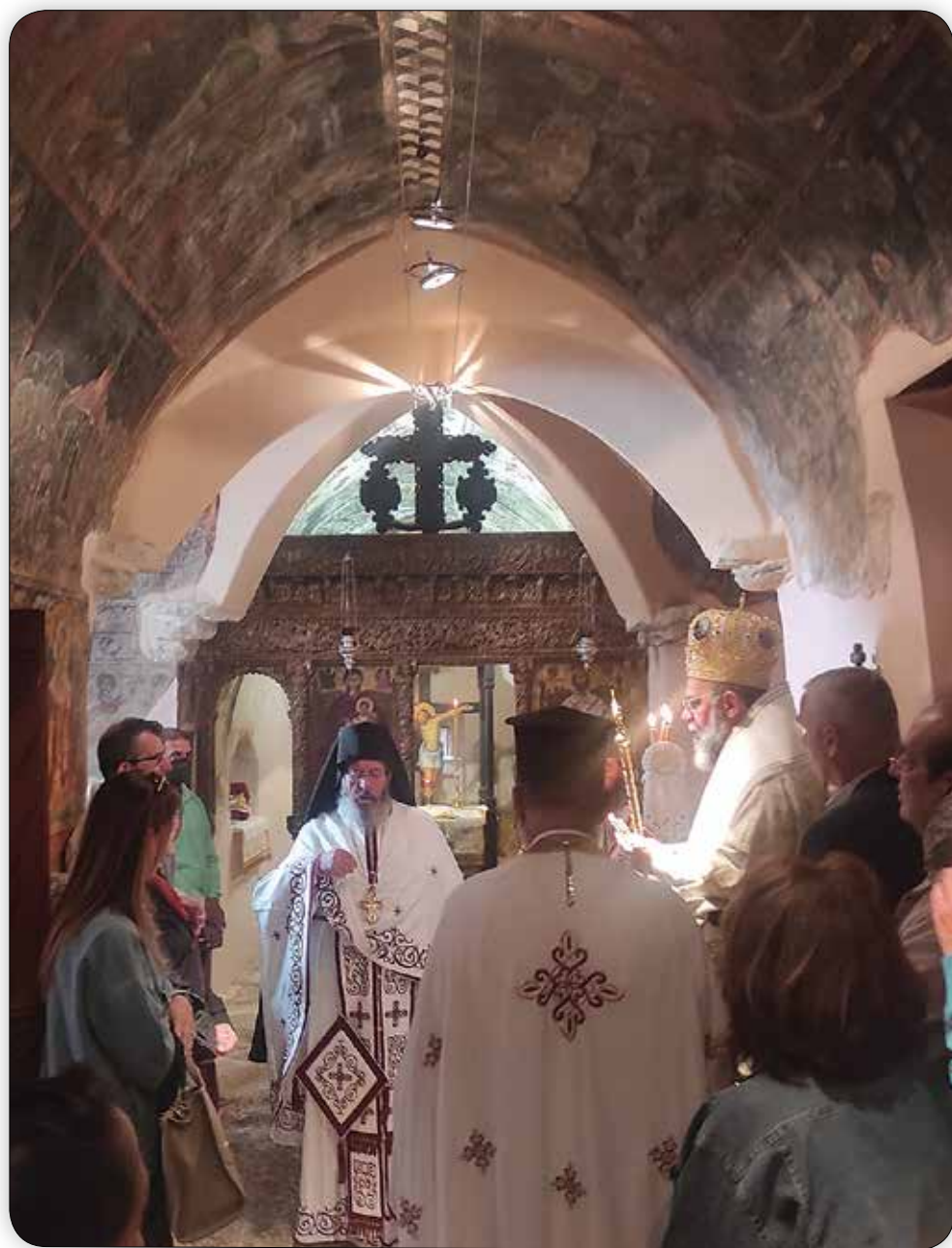
Στιγμιότυπο ἐκ τῆς πρώτης Θ. Λειτουργίας τοῦ Σεβ. Μητροπολίτου Σύμης κ. Χρυσσοστόμου εἰς τό Παλαιόν Καθολικόν.