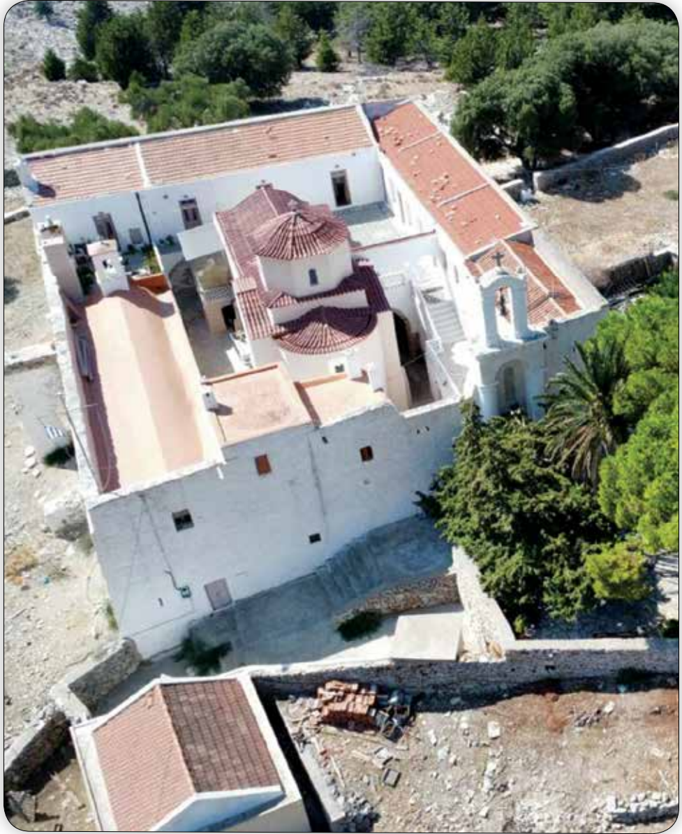
Άεροφωτογραφία τοῦ Μοναστηριακοῦ συγκροτήματος τῆς Ἱερᾶς Μονῆς Ταξιάρχου Μιχαήλ τοῦ Ρουκουνιώτου Σύμης.