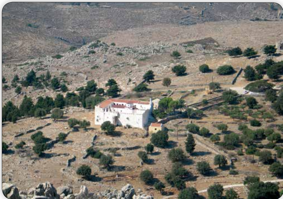
Ἐξωτερική ἄποψη τῆς Ἱερᾶς Μονῆς Ρουκουινιώτου.