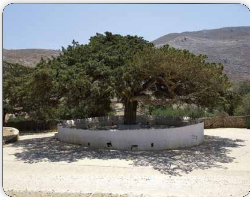
Ἡ ἱστορικὴ κυπάρισσος τῆς Ἱερᾶς Μονῆς Ρουκουνιώτου.

Στὴν μέση μας τόν ἔχουμε τόν πεῦκον τόν νεῆλυ ὁ ὁμορφὸς μας λυριστὴς μοιάζει τόν Μιχαήλην.