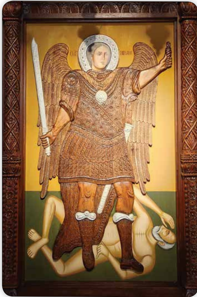
Ἡ ξυλόγλυπτος Εἰκόνα τοῦ Ταξιάρχου Μιχαήλ Ρουκουνιώτου, ἔργον τῶν Συμαίων Ευλογλυπτῶν Μιχαήλ καί Ἰακώβου Μισοῦ.