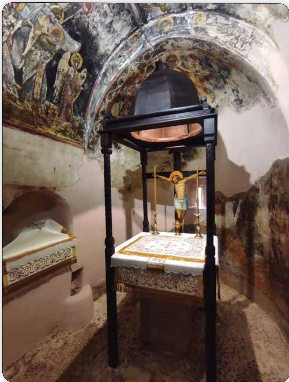
Γενική άποψη του Άγιου Βήματος του Παλαιου Καθολικου της Τερσας Μονης Ρουκουνιωτου.