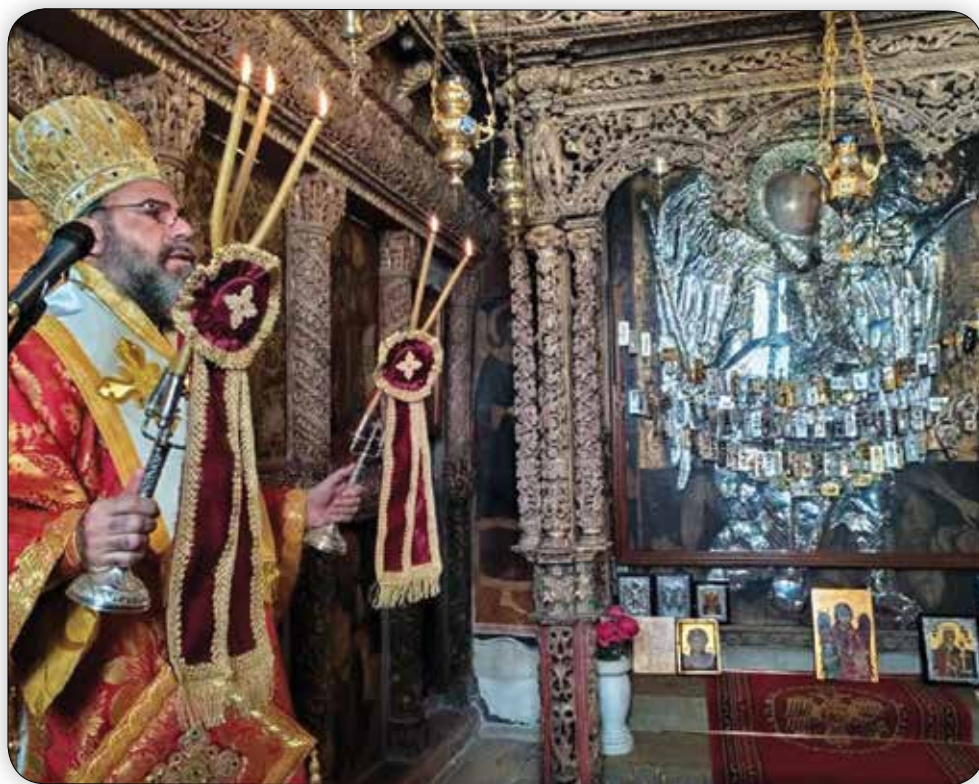
Ὁ Σεβ. Μητροπολίτης Σύμης κ. Χρυσόστομος λειτουργός στήν Ἱερά Μονή Ρουκουιῶτου τὴν Κυριακὴ 31ῆ Ἰαννουαρίου 2021.