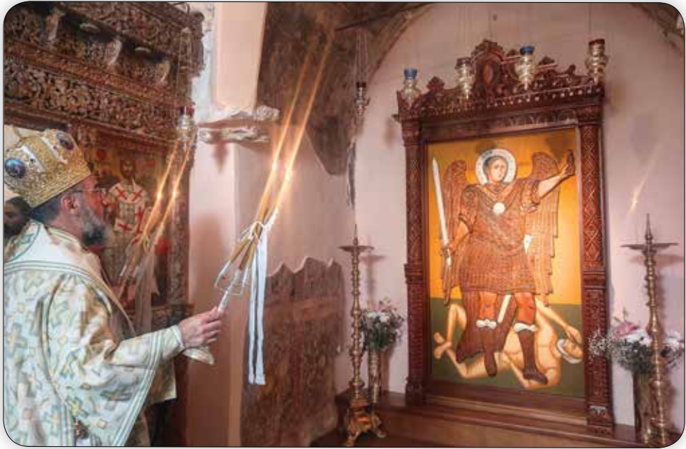
Στιγμιότυπα ἐκ τῆς πρώτης Θ. Λειτουργίας τοῦ Σεβ. Μητροπολίτου Σύμης κ. Χρυσσοστόμου εἰς τό Παλαιόν Καθολικόν.